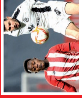
1ª RFEF: EL BILBAO ATHLETIC SALVA UN MATCH BALL