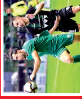
2ª RFEF: EL RIVER GANA EL DERBI Y APUNTA MUY ALTO