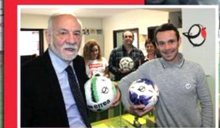
LA FEDERACIÓN IMPULSA EL EUSKERA